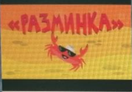
Весёлая физминутка для детей