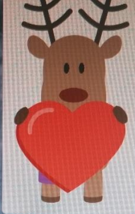
Перевод с детского языка на взрослый