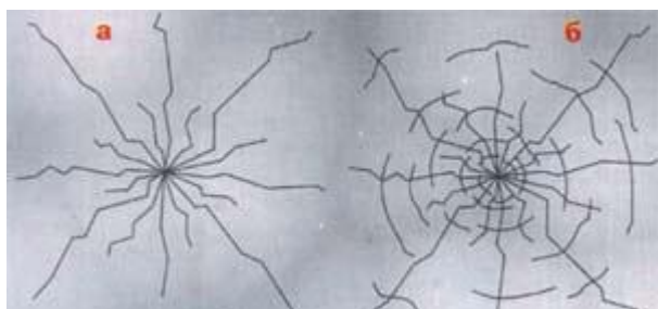
Рис.4. Типы растрескиваний льда под нагрузкой: а – радиальные трещины, не ведущие к провалу груза; б – радиальные трещины, сопровождаемые концентрическими разрушениями, ведут к быстрому провалу груза.

Об упругих свойствах льда говорят следующие количественные данные. Если рассматривать прозрачный, наиболее прочный лед, то при центральном прогибе его в 5 см трещин на нем не образуется; прогиб в 9 см ведет к усиленному образованию трещин, прогиб в 12 см вызывает сквозное растрескивание, при 15 см лед проваливается. Трещины под действием нагрузок возникают двух типов: радиальные (рис.4-а) и концентрические (рис.4-б).