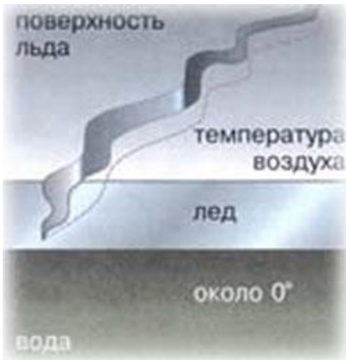
Рис.1. Разлом на поверхности льда, вызванный его температурной деформацией.

Однако хаотичность трещин на поверхности льда только кажущаяся, если помнить о механизме льдообразования: прежде всего в начале зимы, когда лед еще не везде одинаков по толщине, напряжения проявляются по границам стыковки толстого и тонкого ледового покрова, то есть там, где мелководье резко переходит в глубину. При этом глубокая сторона водоема будет определяться по близко располагающейся к обычно крутому берегу трещине, и наоборот.