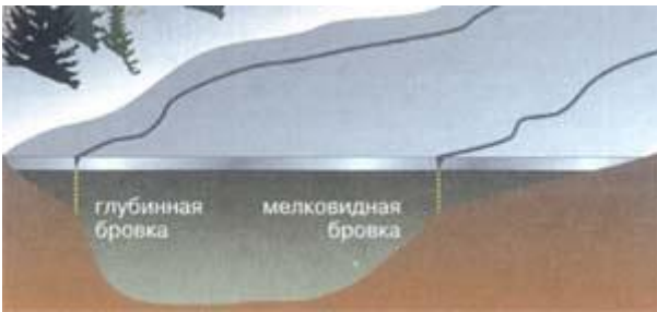
Рис.2. Образование первичных трещин в местах стыковки льда с различной толщиной.

Однако хаотичность трещин на поверхности льда только кажущаяся, если помнить о механизме льдообразования: прежде всего в начале зимы, когда лед еще не везде одинаков по толщине, напряжения проявляются по границам стыковки толстого и тонкого ледового покрова, то есть там, где мелководье резко переходит в глубину. При этом глубокая сторона водоема будет определяться по близко располагающейся к обычно крутому берегу трещине, и наоборот.